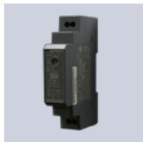
Transformator 24 VDC