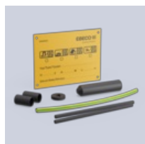
An/avslutningssats T-18/T-18 CT

Läs mer om produkten: https://www.ebeco.se/produkter/snosmaltning-tak/t-18-ct