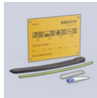
An- /avslutningssats F-10 Silikon

Läs mer om produkten: https://www.ebeco.se/produkter/frostvakt/f-10