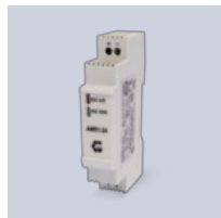
Transformator 24 VDC

Läs mer om produkten: https://www.ebeco.se/produkter/snosmaltning-mark/mi-60